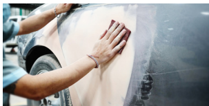
Talleres de Carrocería